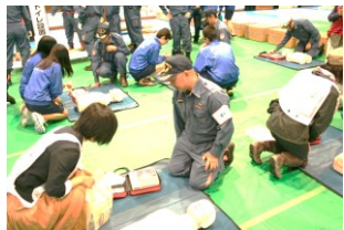
How to use an AED