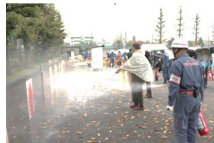
How to use a fire extinguisher