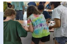
子ども教室 Children's Class