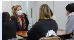
Children's Class for Multicultural Understanding