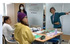
日本語教室 Japanese Class