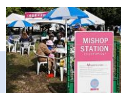
9/24 三鷹国際交流フェスティバル Mitaka International Festival