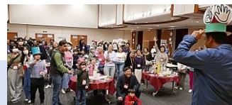
12/2 フェアウェルパーティー 2023 Farewell Party 2023