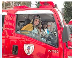
Full-Scale Disaster Preparedness Drill