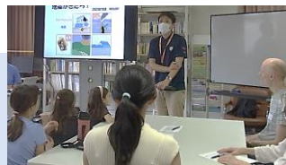
Disaster Preparedness Workshop