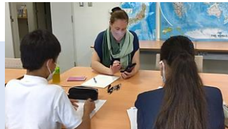
Interviewed by Junior High Student Interns