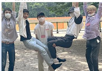
International Walk Rally