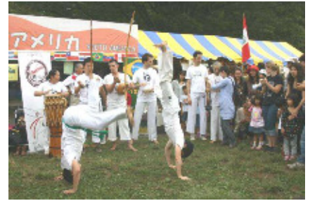
多文化紹介のプログラム the Multicultural introduce tent “World Bazaar Attraction” 各出店団体による「多文化紹介プログラム」の実施