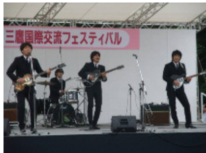
メインステージ Stage performance