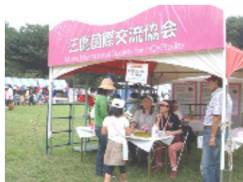
「MISHOP STATION」 Introduction of MISHOP's activities 三鷹国際交流協会の活動を紹介