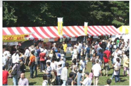
「ワールドバザール」 大使館や NGO、Fairtrade など、世界各国のテントショップ