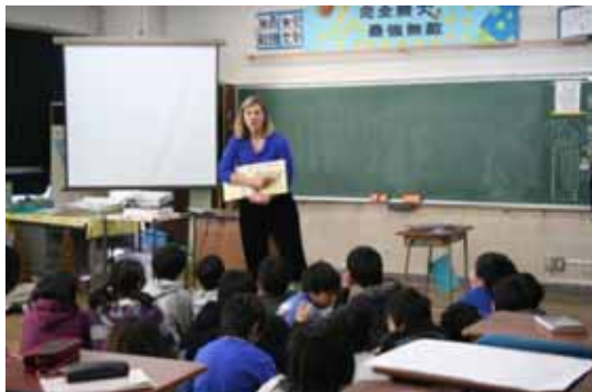
国际理解教育程序