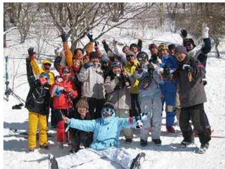
国际交流滑雪旅行