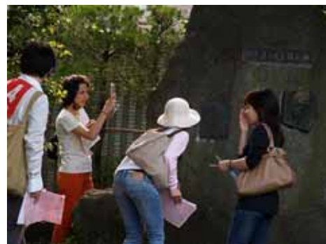
国际交流步行比赛