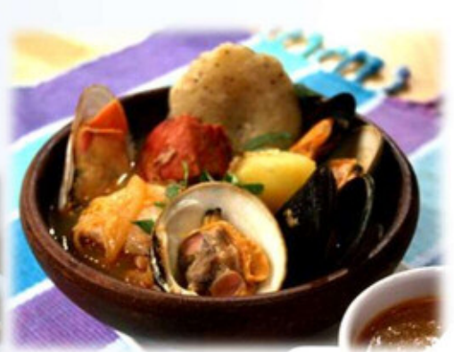
"curanto en olla"