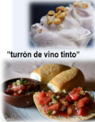
"turrón de vino tinto"

世界各国の料理を作りながら、交流を楽しむ企画、「世界を食べよう」。今回は南米チリの料理です。ヴァレリアさんが、おいしいチリの料理をお教えします。会食後に、チリについてのお話やダンスもあります。料理を通して、チリの文化や料理について触れてみませんか?